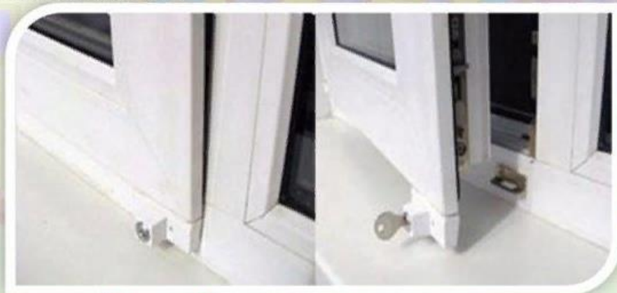
Замок блокировщик с ключом

Можно воспользоваться специальными замками блокираторами, которые предлагают установщики пластиковых окон.